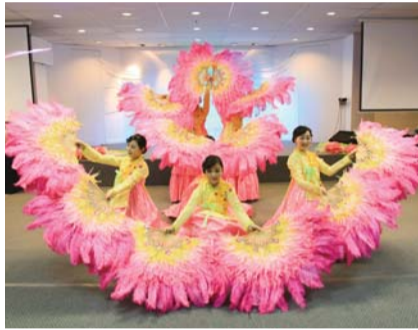
빛의소리중창단의 아름다운 공연과 8개국 목회자, 일꾼들이 준비한 싱가포르 집회 개막행사