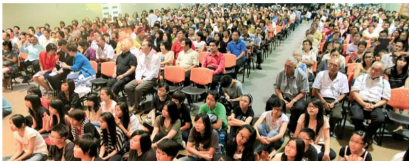
750여 명의 화교 성도와 목회자들이 참석한 말레이시아 말라카 생명교회 집회