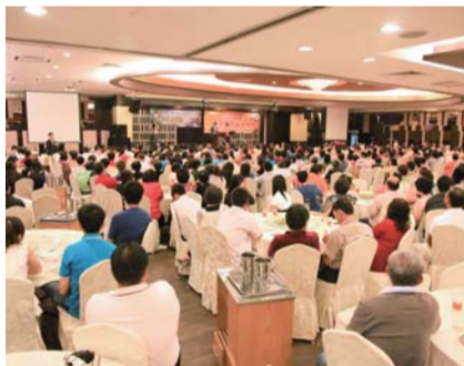
은혜와 감동이 넘쳤던 말레이시아 이포 도시 교회 연합집회와 싱가포르 사인 오디토리움 집회