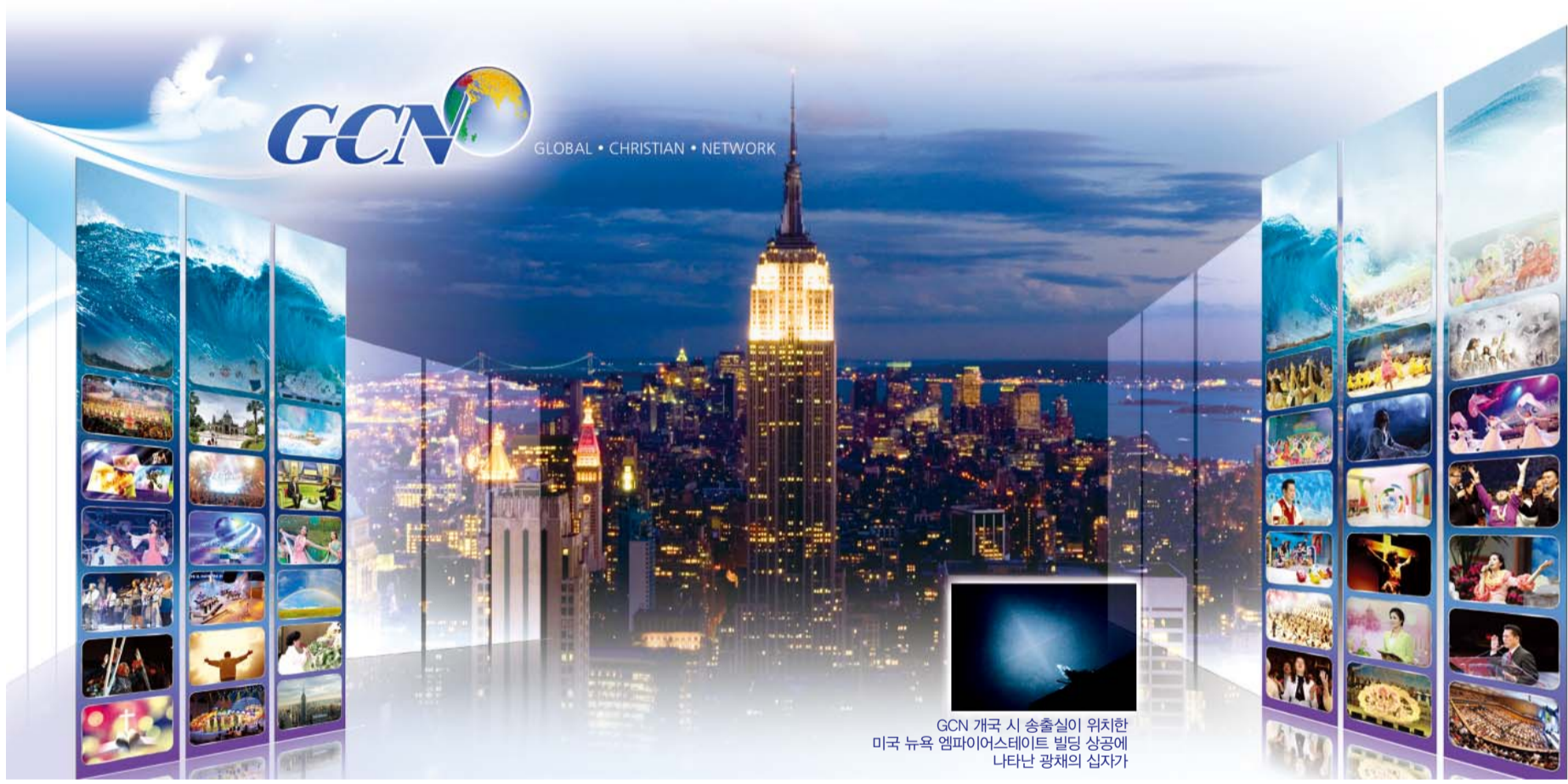
GCN 개국 시 송출실이 위치한 미국 뉴욕 엠파이어스테이트 빌딩 상공에 나타난 광채의 십자가

요즘 세상은 위성, 케이블, 공중파, IP TV, 그리고 스마트폰을 통한 모바일 방송까지 가히 초고속 멀티미디어 시대라 할 수 있다. 낱알이 방송 매체가 다양화됨에 따라 프로그램은 넘쳐나지만 정작 시청자들이 양질의 유익한 프로그램을 선택하기란 쉬운 일이 아니다.