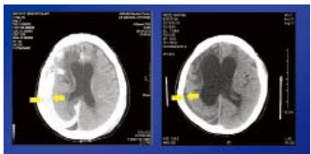
기도받기 전 뇌출혈 소견 기도받은 후 뇌출혈 사라짐

49세인 남성 환자에 관한 사례이다. 환자는 2012년 12월 13일, 병판 길에서 넘어져 응급실로 이송됐다. 그는 1991년 교통사고로 인한 우측 뇌의 혈종으로 수술을 받은 적이 있다.