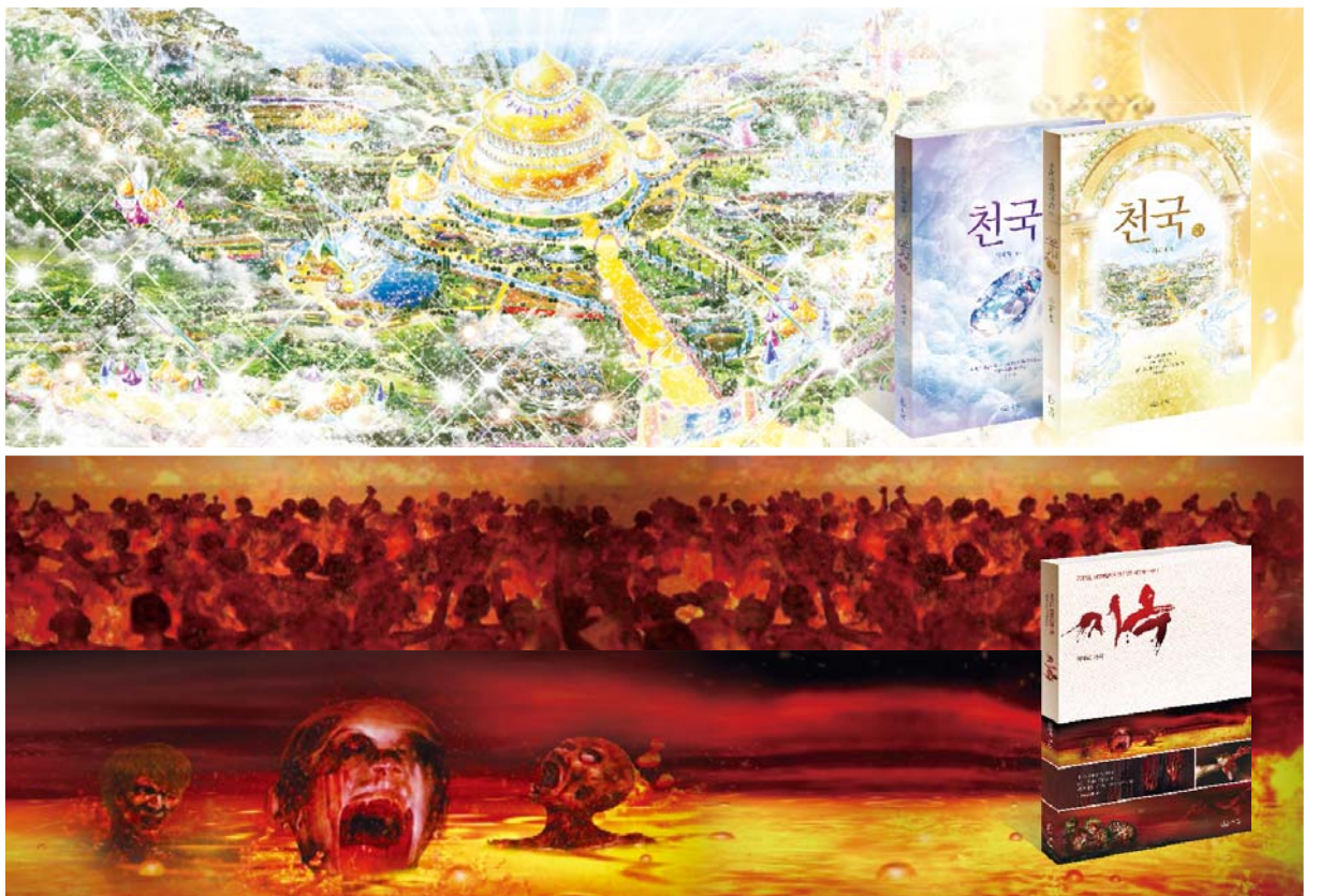
모든 사람이 구원을 받으며 진리를 아는 데 이르기 원하시는 사랑의 하나님께서는 구원받은 자녀들과 세세토록 참 사랑과 행복을 나누며 살아갈 아름다운 천국을 예비해 주셨다. 반면 끝까지 주님을 영접지 않거나 믿는다고 하면서도 범죄한 영혼들은 지옥에 갈 수밖에 없다. 당회장 이재록 목사(왼쪽 사진)는 무수한 금식과 기도로 천국과 지옥에 대해 자세히 풀이받아 『천국』(상)·(하)와 『지옥』을 발간해 전 세계 수많은 영혼을 구원의 길로 인도하고 있다.

세계 선교의 초석이 된 사도 바울은 낙원을 본 뒤(고후 12:2~4) 천국 소망 가운데 죽도록 충성하며 성령의 권능으로 땅 끝까지 주님의 증인이 됐다. 성경 곳곳에 영의 세계에 대해 기록돼 있는데, 천국과 지옥은 눈에 보이지 않지만 실존하는 곳이다.