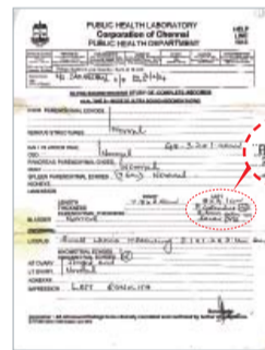
기도받기 전 : 좌측 신장에 3.5cm 결석이 보임.