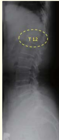
▲ 기도받기 전 흉추 12번이 압박골절되어 척추가 앞으로 구부러져 있다.

그래서 2006년 10월, 저는 한국에 오게 되었고 대림동 친척집에 머물면서 수술비