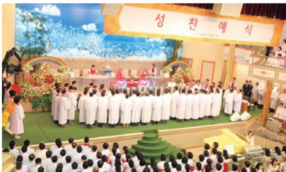
2015년 부활주일 성찬예식

부활절은 기독교의 3대 절기 중 하나로, 기독교 신앙에서의 부활은 이미 죽은 사람이라 해도 주님께서 다시 오실 때에 부활체로 변화되어 영원히 사는 것을 뜻한다(3면 참조).