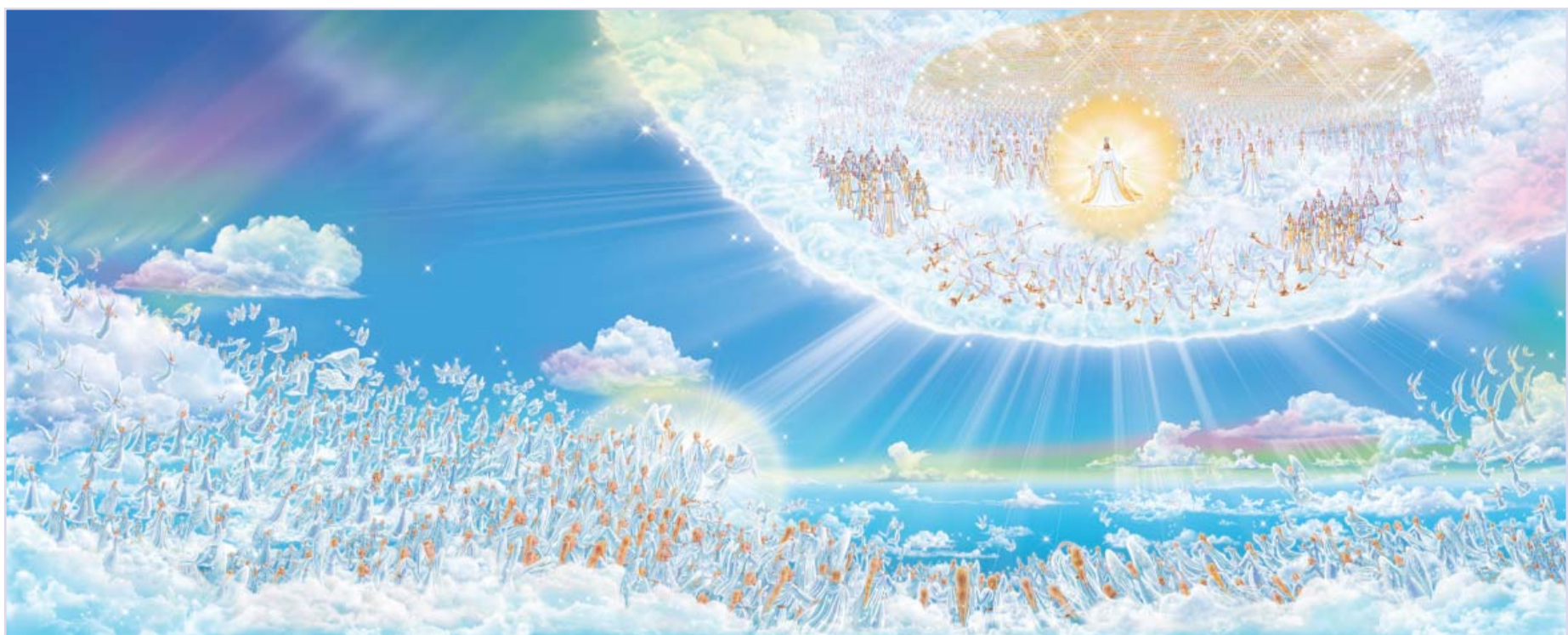
부활체를 입고 공중강림하신 주님과 구원받은 성도들