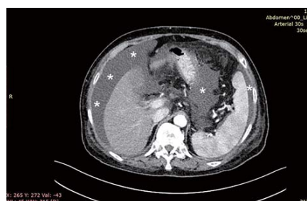
▲ 기도 받기 전 : 간 주변과 비장 주변에 간경화로 인한 복수(하얀별표)가 상당량 보임.