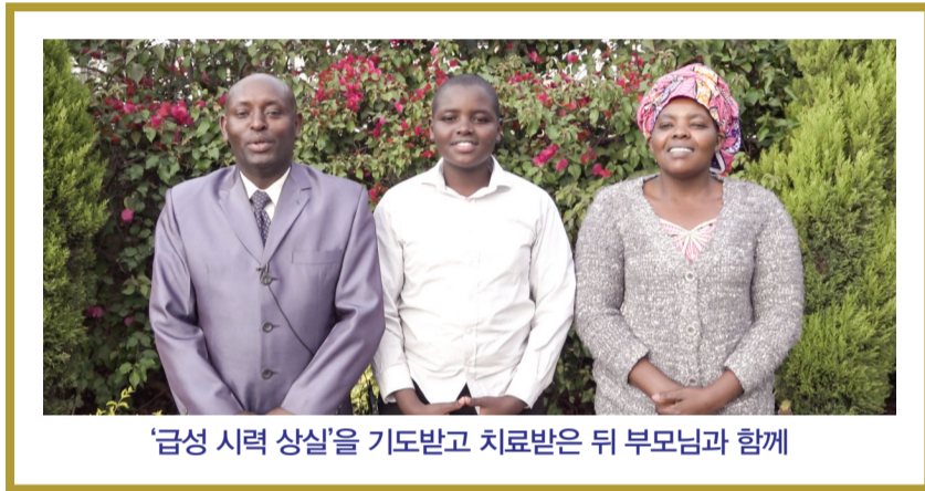
‘급성 시력 상실’을 기도받고 치료받은 뒤 부모님과 함께

갑자기 온 시력 상실로 아무것도 안 보이는 그 캄캄함은 너무도 두려웠습니다. 하지만 이를 통해 주님께서 지은 어둠의 지옥으로 떨어질 수밖에 없었던 저를 밝은 빛으로 건져 주셨지요. 사랑의 아버지 하나님께 모든 감사와 영광을 돌립니다.