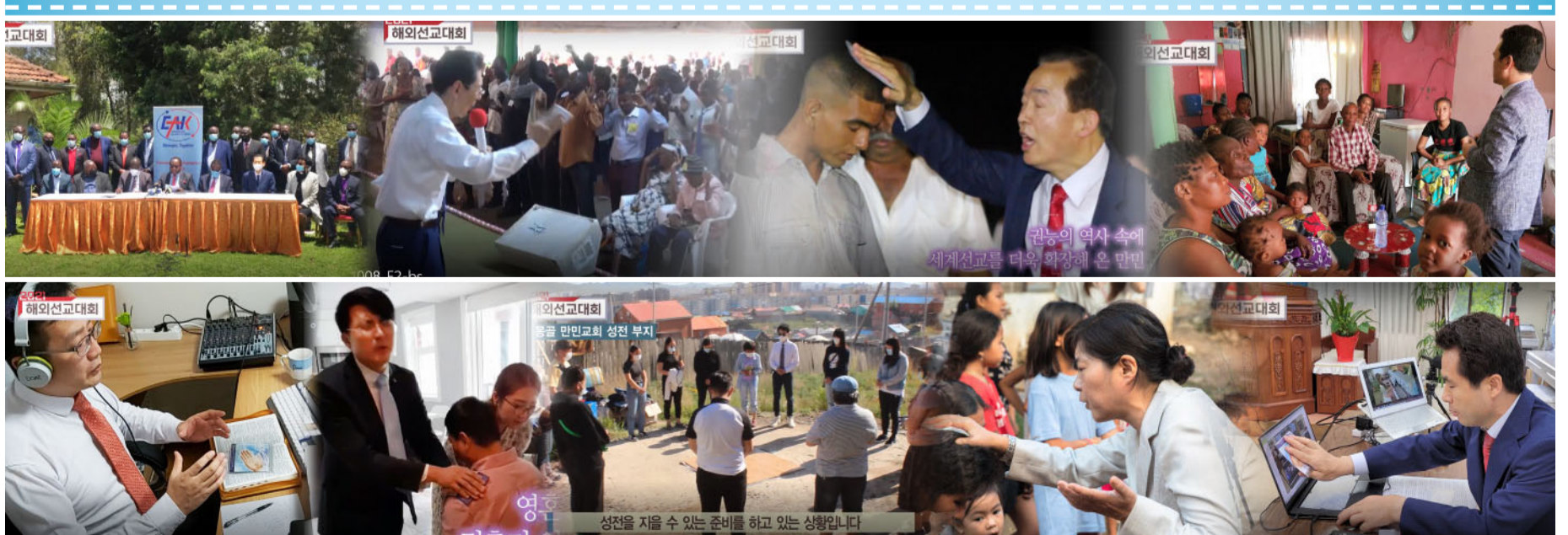
▲ 세계 곳곳에서 성결의 복음과 권능의 역사를 통해 주의 복음을 전하며 헌신하는 선교사들을 통해 만민의 세계 선교는 지금도 활발히 이뤄지고 있다(2021 해외선교대회 영상).

지난 10월 8일 금요일예배 2부 시에는 ‘2021 해외선교대회’ 영상을 상영해 국내외 랜선을 통한 언택트 선교 및 GCN방송을 통한 방송 선교와 우림복의 문서 선교, 해외 지교회들의 활발한 선교 사역 등 지금도 멈추지 않고 만민을 통해 그 섭리를 이뤄 가시는 좋으신 아버지 하나님께 감사와 영광을 돌렸다.