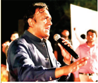
하룬 임란 길 목사 (40세, 파키스탄 편자브 주의회 의원)