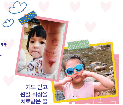
기도 받고 왼팔 화상을 치료받은 딸

2022년 11월 19일, 스트레칭을 하던 중 왼쪽 손목이 찌릿찌릿하고 통증이 느껴졌지만 대수롭지 않게 생각했습니다. 그런데 다음날 설거지를 하던 중 “앗!” 소리가 날 정도로 왼손에 통증이 심해서 그릇을 놓치고 말았지요.