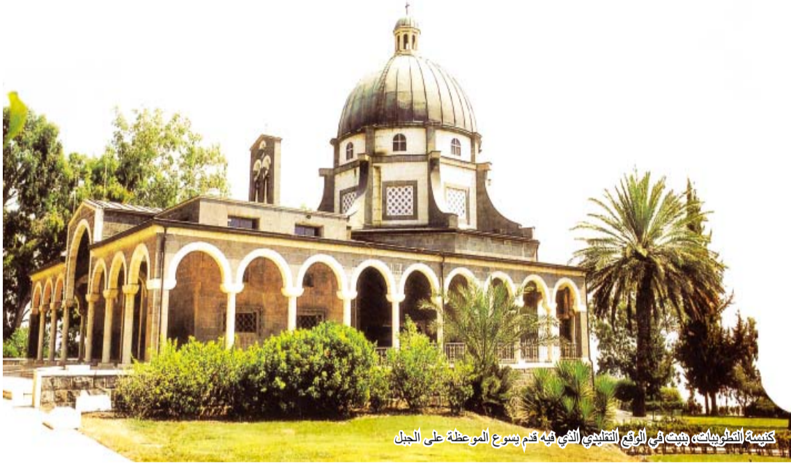
كنيسة التطويبات، بيت في الموقع التقليدي الذي قدم يسوع الموعظة على الجبل