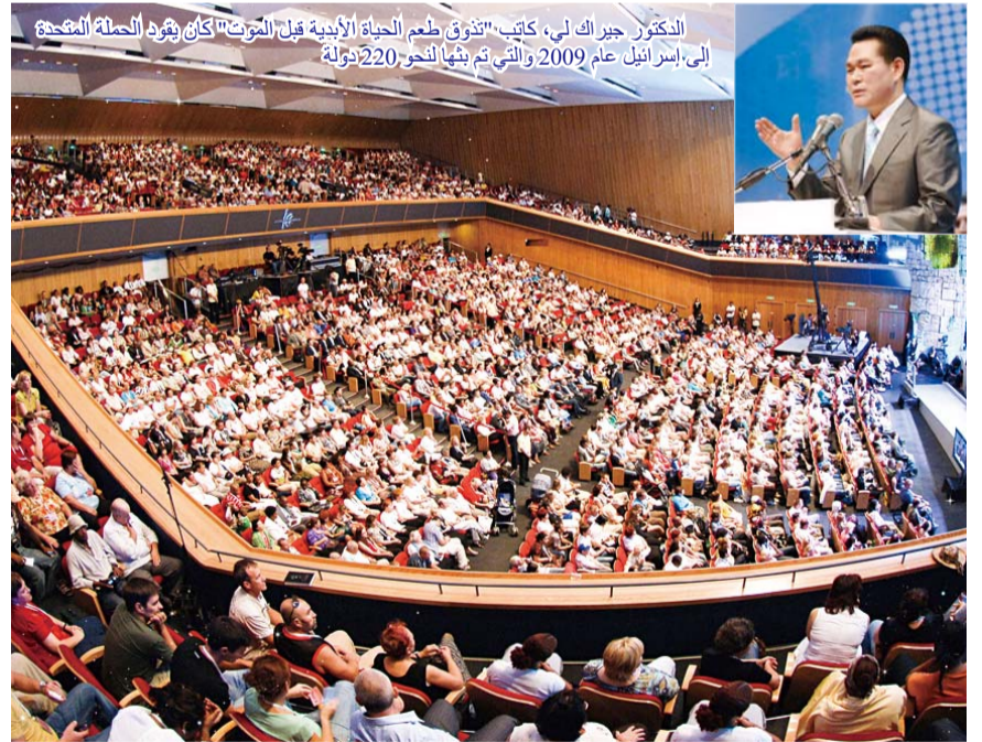
الدكتور جيراك لي، كاتب "تذوق طعم الحياة الأبدية قبل الموت" كان يقود الصلاة المفجعة إلى إسرائيل عام 2009 والتي تم بثها لنحو 220 دولة

"إن النسخة باللغة العربية لهذا الكتاب أصبحت متاحة في لبنان وبقراها الشعب اللبناني. هي رسول للبركات يحمل مشاعر عظيمة ورجاء لهم. أمل الحصول على كتب الدكتور جيراك لي مترجمين وتم إصدارهم باللغة العربية، الأرمنية، والإيرانية وتوزيعهم في الشرق الأوسط." القس اناتيا كاستاتيان من لبنان