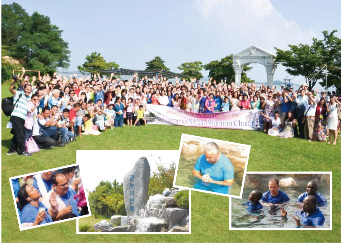
لقد قام الكثيرون بزيارة موقع مياه موآن العذبة منذ شهر مارس 2000. لقد اختبروا اعمال الشفاء، الاستجابات، والأمور الروحية وبهذا امتلأوا بحمبة الله وبالرجاء للسماء. (الصورة الرئيسية: القسس والأعضاء من الفروع عبر البحار في موقع مياه موآن العذبة، 6 آب. غيرها: النصب التذكاري لمياه موآن العذبة والزائرون الذين كانوا يغمسون أنفسهم في المياه بحسب رغبات قلوبهم)