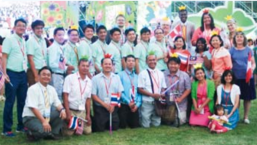
في مؤتمر ماتمين الصيفي 2015، الكثير من الصم من خارج البلاد ابتدأوا يسمعون ويختبرون اعمال الشفاء (القس جانغهيون جي، من اليسار، من الأمام)

أشخاص يسمعون بصورة جيدة لا يعلمون قلب الأشخاص الصم. لكن الراعي المسؤول كان يعلم قلب كل واحد منهم وصلى لأجلهم بحرارة. يا ليت الكثير من الصم يأتون لمعرفة إنجيل القداسة وقوة الراعي وليتم الوصول لكل أبرشية الصم في العالم!