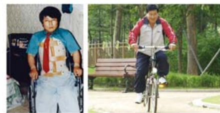
Nakagamit siya og 'brace' para sa iyang likod og matulog nga maglingkod, apan karon mahimo nang mag bisiklita.

Akong pasalamatang og himayaon ang Diyos nga nanalangin nako sa piskay og malipayong kristohanong kinabuhi bisan ako tigulang na.