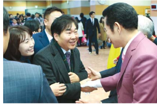
Enero 26, uban sa iyang asawa, si Decono Min Seong nagpamatuud ni Senyor Pastor sa iyang kaayohan.

Dugang pa, dili nako ‘farsightedness’ og ang akong panan-aw maayo na. Akong pasalamatan og himayaon ang Dios nga niayo nako.