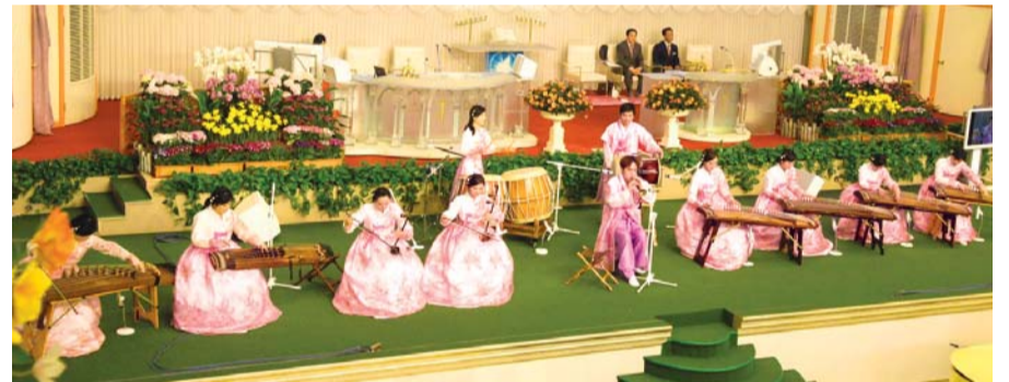
Serem Korean Traditional Music Team naghalad og espesyal nga pasundayag

Akong pasalamatang ang Dios nga nihatag nako ining dakong grasya og niluwas nako sa dihang ako paingon sa kamatayon og nihatag sa paglaom para sa New Jerusalem. Halleluyah!