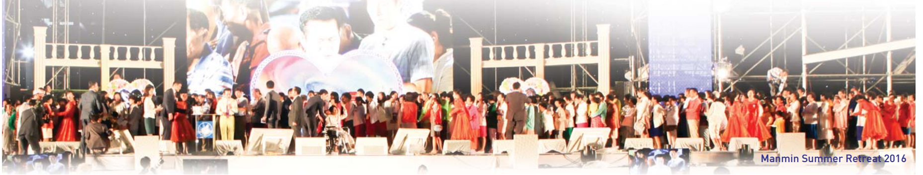
Manmin Summer Retreat 2016

Sa Manmin Summer Retreat matag tuig nga pagahimoon sa buwan sa Agosto, daghan ang nangaayo sa nagkalain-laing sakit lakip na sa AIDS, deprisyon, heart attack, brain hemorrhage, demensya, og pagkabuta. Karon atong paminawon ang mga panghimatuud sa ilang kaayohan.