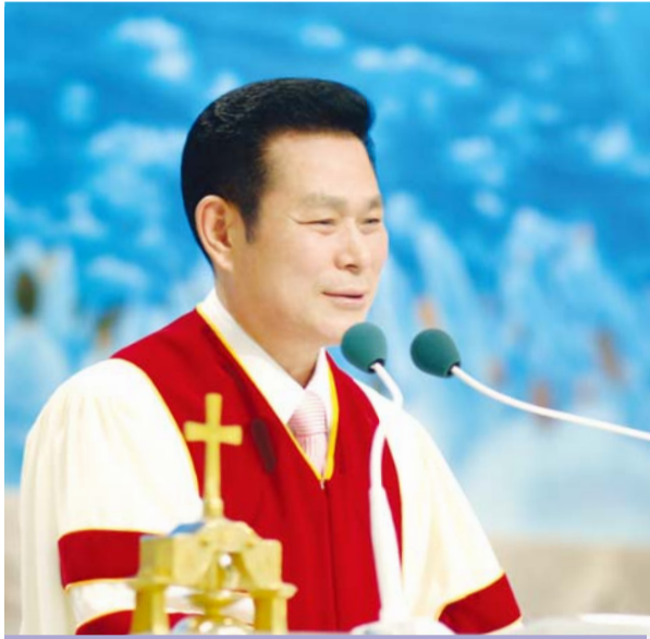
Старши пастор д-р Джейрок Лий

„Възлюбени, да любим един другото, защото любовта е от Бога; и всеки, който люби, роден е от Бога и познава Бога. Който не люби, не е познал Бога; защото Бог е любов“ (1 Йоаново 4:7-8).