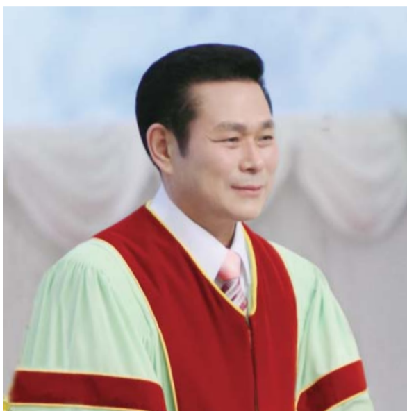
Старши пастор д-р Джейрок Лий

„И чрез никой друг няма спасение; защото няма под небето друго име дадено между човеците, чрез което трябва да се спасим“ (Деяния 4:12).