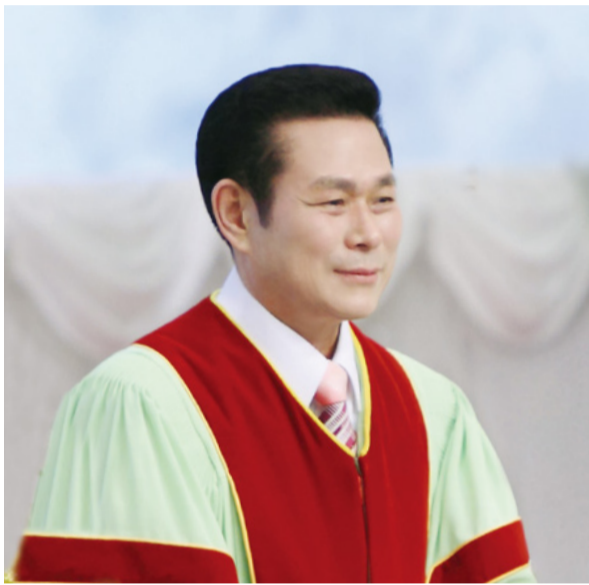
Старши пастор д-р Джейрок Лий

„Не всеки, който Ми казва: „Господи! Господи!“, ще влезе в небесното царство...“ (Матей 7:21). „...Има смъртен грях; не казвам за него да се помоли“ (1 Йоаново 5:16).