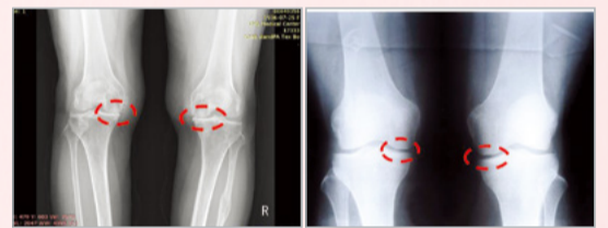
Сканиране с рентгенови лъчи

Невярващите ми близки ме заведоха в болницата. Лекарите казаха, че не можеха да гарантират добър резултат. На 24 март изпитах силен импулс, че щях да се излекувам, ако срещнех старшия пастор. Помолих децата ми да ме заведат на събрание на църковните членове със старшия пастор, проведено в неделя сутринта на 25 март. Заведоха ме в храма в инвалиден стол и синът ми ме носи на гръб по стълбите. Сърцето ми стана горещо и им казах, че исках да седна отпред.