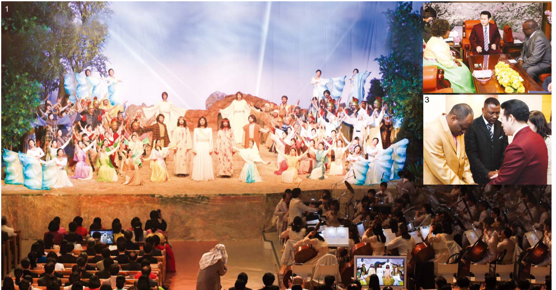
Herdenking Paaszondag, welke een van de drie belangrijkste Christelijke feesten is, de Manmin Central Church had een Paaszondagdienst en vierde ook het Heilige Avondmaal (Foto 1). De leden gaven dank en glorie aan de Here, samen met de buitenlandse pastors en gelovigen die kwamen en deelden de vreugde van het eeuwige leven en de hoop op de opstanding (Foto 2,3).

Des te dieper de liefde van de gemeenteleden wordt voor de Here, des te meer vreugde en dankbaarheid worden toegevoegd. Op 31 maart 2013, werd het Heilige Avondmaal gehouden, tijdens de Zondagavonddienst met Pasen. De dienst werd ook bijgewoond door ongeveer 10.000 geassocieerde gemeenten, via GCN TV ( www.gcntv.org ), welke Pasen nog betekenisvoller maakte.