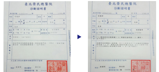
Voor het gebed, diagnose van dementie (Links) Na het gebed, geen symptomen van dementie meer met CDR score 1 (Rechts)