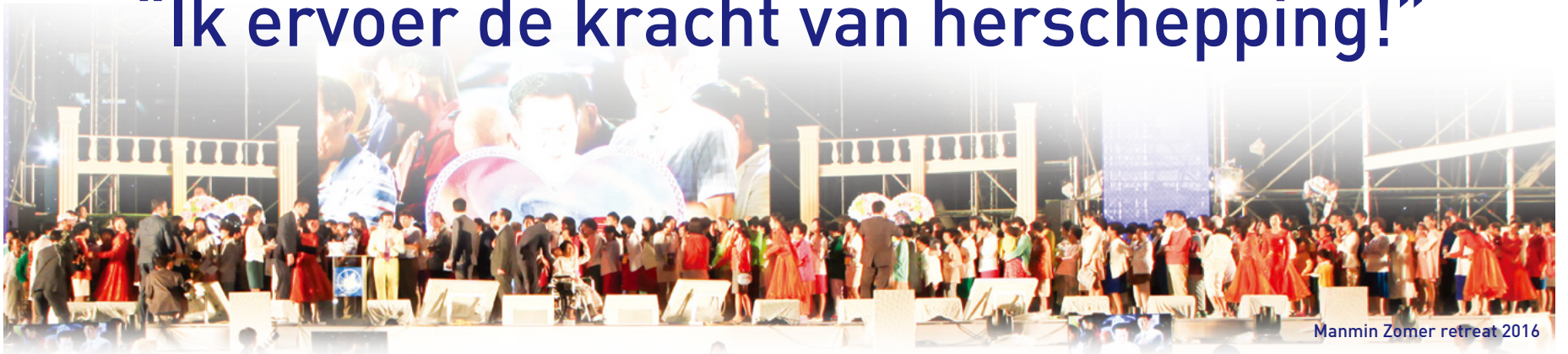
Manmin Zomer retreat 2016

Tijdens de Manmin Zomer Retreat die elk jaar gehouden worden in het begin van augustus, worden vele mensen genezen van vele soorten van ziekten, inclusief AIDS, depressie, hartaanval, hersenbloeding, dementie, en blindheid. Laat ons nu eens horen naar degenen die getuigden van hun genezing.