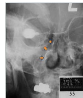
◀ Dakrystograafia: kontrastaine läheb läbi parempoolse nasolakrimaaljuha hästi ninaõõnsusse

Ta nasolakrimaaljuha ummistust ei ravinud arstiteadus, vaid palve. See oli hämmastav. Pärast esitust rõõmustasid paljud kristlikud arstid ja töid Jumalale suurt au.