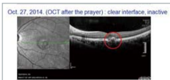
▶ Pärast palvet: selge liides, mitteaktiivne