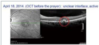
◀ Enne palvet: ebaselge liides, aktiivne