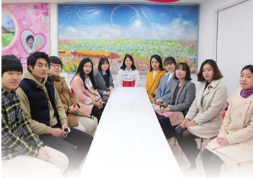
Noorte täiskasvanute misjoni ja õpilaste pühapäevakooli juhtidega

Nüüd on mu tervis taastunud ja ma elan tervelt. Ma tänan kõige eest Isandat, kes lasi mul pääseda haigusevalust ja elada õnnelikult. Halleluuja!