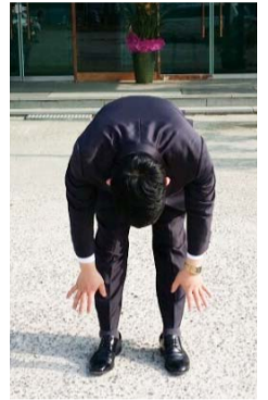
Nyt hän voi taivuttaa ja suoristaa itseään