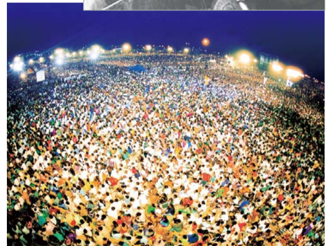
Intian United-ristiretkelle osallistui yhteensä yli 3 miljoonaa ihmistä. Ristiretken aikana vaikea kuivuus hellitti. Monia ihmisiä parannettiin ja kääntyi kristityiksi.