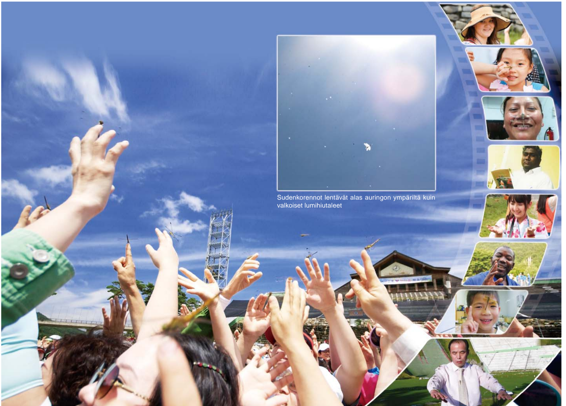
Sudenkorennot lentävät alas auringon ympäriltä kuin valkoiset lumihutaleet

”Oletko nähnyt sudenkorentojen tulevan alas taivaasta?”