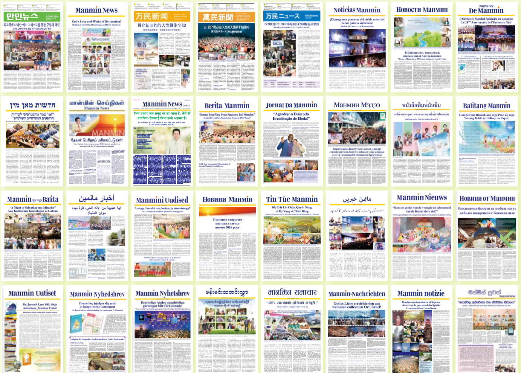
Manmin Uutiset julkaistu 32 kielellä

Manmin Uutiset on levittänyt Luoja-Jumalan voimaa, Jeesuksen Kristuksen evankeliumia ja Pyhän Hengen tekoja maan ääriin asti ja johtanut kaikkien kansojen kaikkia ihmisiä pelastuksen tielle. Manmin Uutiset juhli tänä vuonna 29. vuosipäiväänsä.