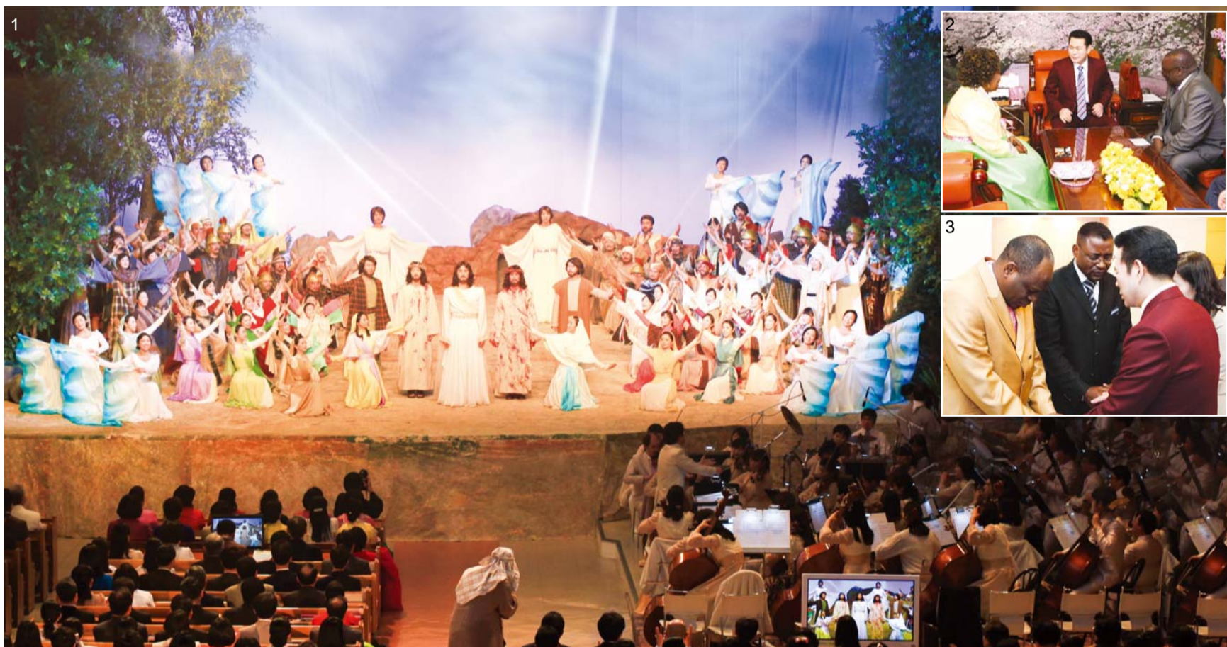
הנצחת יום התחייה שהינו אחד משלושת הקהלים המשיחיים החשובים ביותר – קהילת מאן מין המרכזית ערכה את אסיפת יום התחייה והגנה את סעודת הקָאָדוֹן (תמונות 1). הקברים הקדישו הודיה וכבוד לאדון יחדיו עם רועי קהילה ומאמינים אשר באו מעבר לים והשתתפו בשמחת חיי עולם ובתקווה לתחייה (תמונות 2, 3).

לגרמנים ודרך המסע גברה אמונת המאמינים והקהילות התחזקו. רועה הקהילה קבנגו צפה בהופעת יום התחייה והיו לו הערות לגביה – הוא אמר: "זה היה מדהים. ההופעה הראתה בצורה אמיתית את ייסורי ישוע אשר לקח את חטאי האנושות. ליבי כאב מצפייה במחזה בו הולקה ישוע." ב-31 למרץ 2013 הם קיבלו את: תפילת ד"ר לי בעבור שירותם.