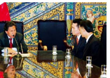
פגישה עם הנשיא הפרובינציאלי אליחדרו טולוז בארמון הנשיאות (30 נובמבר 2004)