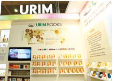
ספר ד"ר ג'יי רוק לי המתורגמים ל-58 שפות