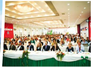
הכנס הרפואי הבינלאומי העשירי של ד"ר ג'יי רוק לי התקיים במקסיקו (יוני 2013)