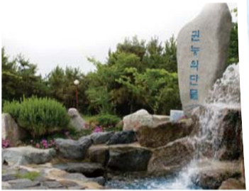
אתר מי מואן הזכים (הייג'מיון מואן – גאן מחוז ג'יאונג)