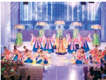
מופעי חגיגות יום השנה ה-30 לקהילה (7 לאוקטובר 2012)