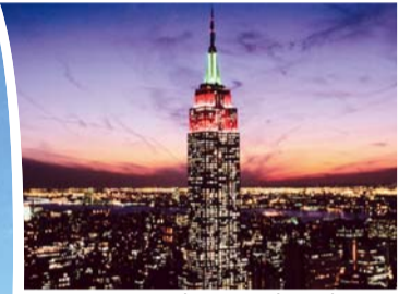
מסדר טלוויזיית ג'י סי אן במגדל האמפייר סטייט בניו יורק

עדויות חברי קהילה אשר שוקררו ממחלות ומעונו וכעת משתתפים במעשי השליחות.