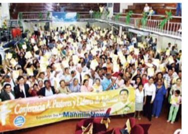
סיום הרצאות מכללת מאן מין הבינלאומית בתשע מדינות לטיניות (נובמבר 2007)