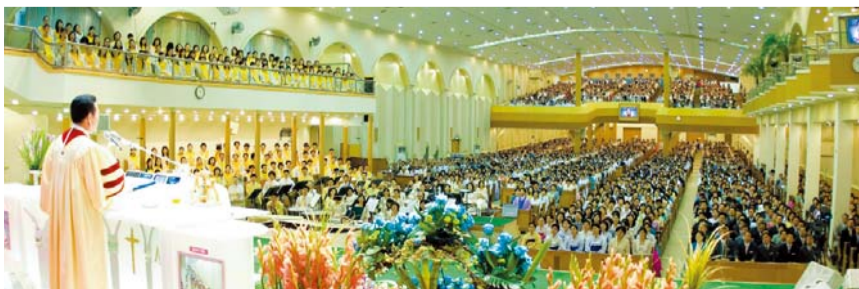
עצרת ההשתחויה של מאן מין אשר שודרה דרך טלוויזיית ג'י סי אן והמרשתת ובה נטלו חלק אנשים מ-170 מדינות לערך