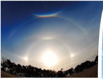
קשת בלתי רגילה בענן (קהילת מאן מין מואן-27 לינאר 2011)