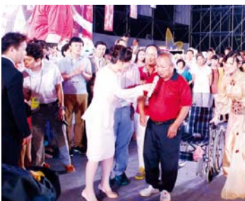
המעידים על רפואתם בכנס הקיץ של מאן מין (5 לאוגוסט 2013)