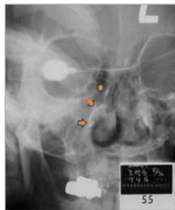
צילום: קדירה טובה אל תוך צינור האף – דמע הקיני

היא עברה ניתוח להקדחת צינור באף אך משהוצא הצינור שוב זלגו הדמעות. המצב המשיך, היא נואשה מן הטיפול ונאלצה לקיות עם הבעייה. בשנת 2014 היא נטלה חלק בכנס הקיץ של קהילת מאן מין וקיבלה את תפילת ד"ר ג'יי רוק לי. ביומו האחרון של הכנס יצאה: הפרשה צהבהבה מנחיריה – דבר שהמשיך כשבועיים. לאחר שבועיים ביום ראשון אחר: היא היתקטשה. מייד חשה שנחיריה נקיים לאורך כל הדרך עד לחלקה התחתון של העיין. חסימת צינור האף – דמע נעלמה. לא היו לה עוד הפרשות מן העיין בעת השינה והדמעות נעצרו. חסימת צינור האף – דמע לא התרפאה בתרופות אלא: בתפילה – דבר מדהים. לאחר המצגת שמחו רופאים משיחיים רבים ונתנו פאר גדול לאלוהים.