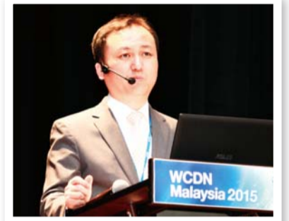
דר' גילברט – נשיא רשת הרופאים המשיחיים העולמית דבליו: המנהל הראשי של בית החולים יונסיי ג'איייל

אנשים אומרים כי העיניים הינן החלון לנפש. מראה עייני משהו יכול להשפיע על הרושם המקורי. במיוחד: עיניים גדולות וברורות מביאות לרוב להתרשמות עדיפה יותר. עפעפיים כפולות (עם כפל אל תוך העפעף העליון) נוצרות כששריר: העצב השלישי המרים את העפעף העליון ומתחבר לעור העפעפיים. לרוב אין לאסייטיים רקמות עור מחוברות לעפעפיים – לכן לרבים מהם אין עפעפיים כפולים. אך רבים מחברי קהילת מאן מין המרכזית קיבלו עפעפיים כפולים ללא כל ניתוח דרך תפילת רועה הקהילה הבכיר ד"ר ג'יי רוק לי: מייסד רשת הרופאים המשיחיים העולמית. הנה כמה מן המקרים הללו.