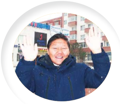
האח קקסורין בן 59 מקהילת מאן מין במונגוליה

הרוע הנמצא בליבי כפי שלמדתי בדבר אלוהים. צמתי והיתפללתי למען העניין.