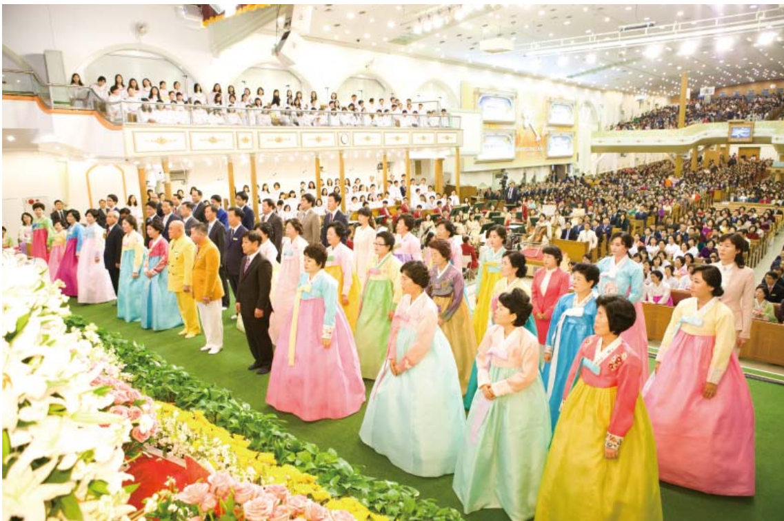
44 זוכים אשר פעלו ב-2015 בנאמנות, שמחה ותודה כחברים בגוף הָאָדוֹן: ארבעה מנהיגי מחוז, שלושה מנהיגי מחוז משנה, ארבעה מנהיגי תא בעדה; מנהיג קבוצה אחד, ארבעה מנהיגי קבוצה קטנים בשליחויות, שישה חברי וועדה, ארבעה חברי קבוצת מתנדבים, שלושה עשר עובדים במשרה מלאה נחמישה מתנדבים.

מכן ניבצר הַיְמִנִי להניע באורח חופשי את צווארי. אך משפגשתי רועה הקהילה הבכיר וקבלת תפילתו: ירדה עלי אש רוח הקודש וכל תופעות – הלוואי נמוגו. מאז ועד היום החילוני להיתהלך בחיים משיחיים אמיתיים. כעת הינני מלא בשמחת הישועה ובתקוות השמים – וחש שוב צעיר". בנוסף ל – 44 הזוכים חודשו: רבים מחברי קהילת מאן מין על ידי כוח רוח הקודש – נאנו פועלים בנאמנות עבור מלכות אלוהים: באמונה, תקווה ובהכרת טובה – לעין, לאדוננו ולאהבת אלוהים הבורא.