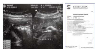
אבן מרה בגודל 18.2 מילימטר נעלמה