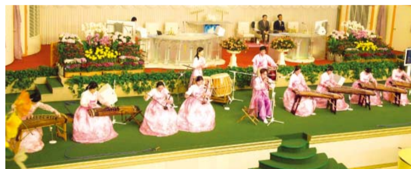
צוות סרם למוסיקה קוריאנית מסורתית מבצע: הופעה מיוחדת

לאחר הצבא שבתי לבית הספר. היו לי הופעות רבות בבית הספר ורכשתי יותר חברים. ביליתי ימים רבים