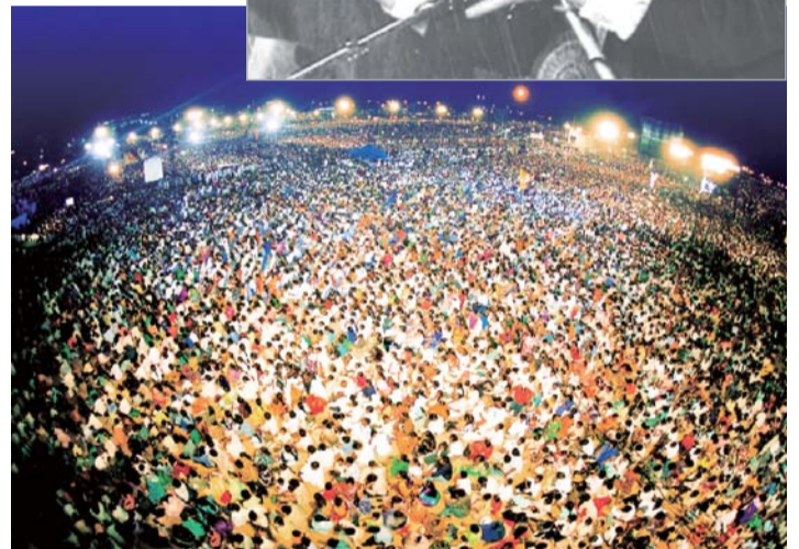
KKR akbar di India pada tahun 2002 dihadiri sekitar tiga juta orang. Selama KKR berlangsung, kekeringan yang terjadi turun hujan. Dan banyak orang yang disembuhkan dan juga banyak yang bertobat jadi Kristen.