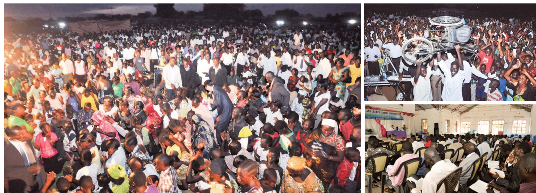
Африк дахь Есүс Христийн Нэгдсэн Ариун урсгалын сүмийн удирдагч Доктор Жон мёон хо пасторыг урьж Африк Өмнөд Суданд болсон номлогч нарын семинар болон гар алчуурын цуглаанд гайхамшигт эдгэрлийн үйлсүүд маш их илчлэгдсэн бөгөөд Амьд оршигч Бурхандаа талархал ба алдрыг өргөе!