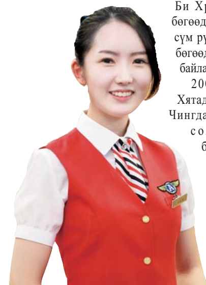
Гү Өнь хэ эгч дүү (Донг яан Нисахийн Их Сургуулийн 4-р курсийн оюутан, Чүнчон Манмин сүм)

Би Христчин гэр бүлд төрсөн бөгөөд багаасаа эцэг эхийгээ даган сүм рүү ирж очдог л нэгэн байсан бөгөөд жинхэнэ христчин хүн биш байлаа.