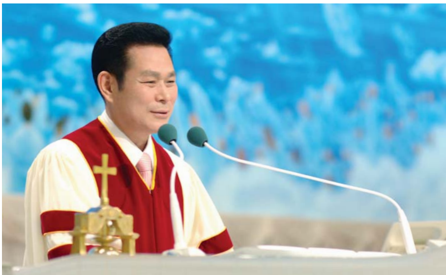
Доктор И Жаерок Тэргүүн Пастор

Мөн Египетээс гарсан нь 12:46 дээр болон Тоолого 9:12-д Бурхан Израйльчуудад “Тэд хургыг идэх болно гэхдээ ямар ч ясыг нь хугалалгүй байх ёстой” хэмээн зарлиг болгосон байдаг. Библи дээрх “хурга” хэмээн дурдаж байдаг нь Есүсийг төлөөлөн хэлж байгаа билээ. (Иохан 1:29). Тийм учраас Есүсийг төлөөлж буй хурганы ясыг бүү хугал хэмээн тушаасан бөгөөд энэхүү