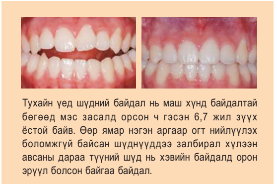
Тухайн үед шүдний байдал нь маш хүнд байдалтай бөгөөд мэс засалд орсон ч гэсэн 6,7 жил зүүх ёстой байв. Өөр ямар нэгэн аргаар огт нийлүүлэх боломжгүй байсан шүднүүддээ залбирал хүлээн авсаны дараа түүний шүд нь хэвийн байдалд орон эрүүл болсон байгаа байдал.

Надад дурдах бас нэгэн гайхамшигт гэрчлэл байгаа билээ. Энэ жилд эхний хагаст болсон “2 удаагийн Онцгой Даниел Залбирал”-ын цагт миний нүүрний хэв магь маань өөрчлөгдсөн гайхамшигт зүйл тохиолдов. Урьд нь гурвалжин хэлбэртэй нүүр царайтай байдаг байсан ба үзээ хойшоо шуухаар туранхай эвгүй харагддаг байлаа. Одоо зуван сайхан нүүртэй болсон тул үзээ хойшоо шууж боохоор яг зохицон сайхан харагддаг болсон юм. Сүмд явдаг гэх боловч Бурханы үгийг огт хайхралгүй явж байсан надад энэ мэт эрхэм нандин зүйлийг мэдрүүлж өгсөн Бурхан Авдаа, хайрт Эзэндээ талархал алдрыг өргөн барьяа!