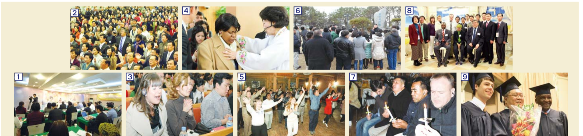
Оролцогчдын Фото Зурагнууд ■ Фото 1: Хичээлдээ шимтэн сууж буй оролцогчид ■ Фото 2: Баасан гаригын Оройн цуглаанд бялхал дүүрэн магтаал ■ Фото 3: Даниел залбирлын цагаар ■ Фото 4: Манмин залбиралын төвийн “Эдгэрэл ивээлийн цуглаан”-ы үеэр ■ Фото 5: Мүан амтат усны хүрээлэн дэх Магтан дуу ба залбиралын цуглааны үеэр ■ Фото 6: Мүан амтат усны хүрээлэн дэх тусгай цаг ■ Фото 7: Мүан амтат усны хүрээлэн дэх Магтаал ба шийдвэр гаргах цаг ■ Фото 8: GCN ТВ дээр хийсэн айлчлал ■ Фото 9: Хоёрдугаар сарын 26-нд болсон Төгсөлтийн үйл ажиллагаа

Юуны өмнө 2009 онд Израйлийн нийслэл Иерусалим хотод Израйлийн нэгдсэн их цуглааны зохион байгуулж олон мянган итгэгчдийг сэргээсэн Манмин Төв Сүмийнхэнд болон Доктор И Жей руг пасторт талархсанаа илэрхийлэв. Энэ мэт чухал том ажлыг хийсэн Манмин Төв Сүмд өөрийн биеэр ирээд сүнс зүгийн үг сургаалиар зэвсэглэн, залбирлын дасгалжуулалтыг авах нь миний хувьд нэр төрийн хэрэг билээ. Би магтаалын удирдагч болохоор магтаал дуу бүжгийн хэсгийн багш нар магтаал дуу, вошип түүнд хэрэглэгдэх хэрэгсэл болон хувцаслалт, зэргээр хичээл ороход олон зүйлийг ойлгон сурч, их ивээл авсан юм. Эдгээр эрхэм багш нарын тоглолтын талаарх хичээлүүдийг хичээнгүйлэн камертаа бичлэг хийж авсан юм. Эндээс сурч мэдэж авсан зүйлсээ сайн ашиглаж Эзэний баярлан таалан хүлээн авах магтаалыг өргөж, ариун сайн мэдээг идэвхитэй сайн тараахыг хүсэж байна. Энэхүү сургалт нь миний хувьд агуу их ерөөлийн цаг байлаа.