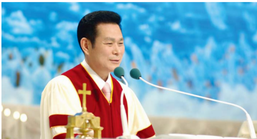
Доктор И Жей руг Тэргүүн Пастор

Үүний дагуу, өөр нэгэн зүрх сэтгэл, зүрх сэтгэлийн ухаарал бий болов. Зүрх сэтгэлийн ухаарал гэдэг нь анх хүн бий болсоныхоо дараа маш их