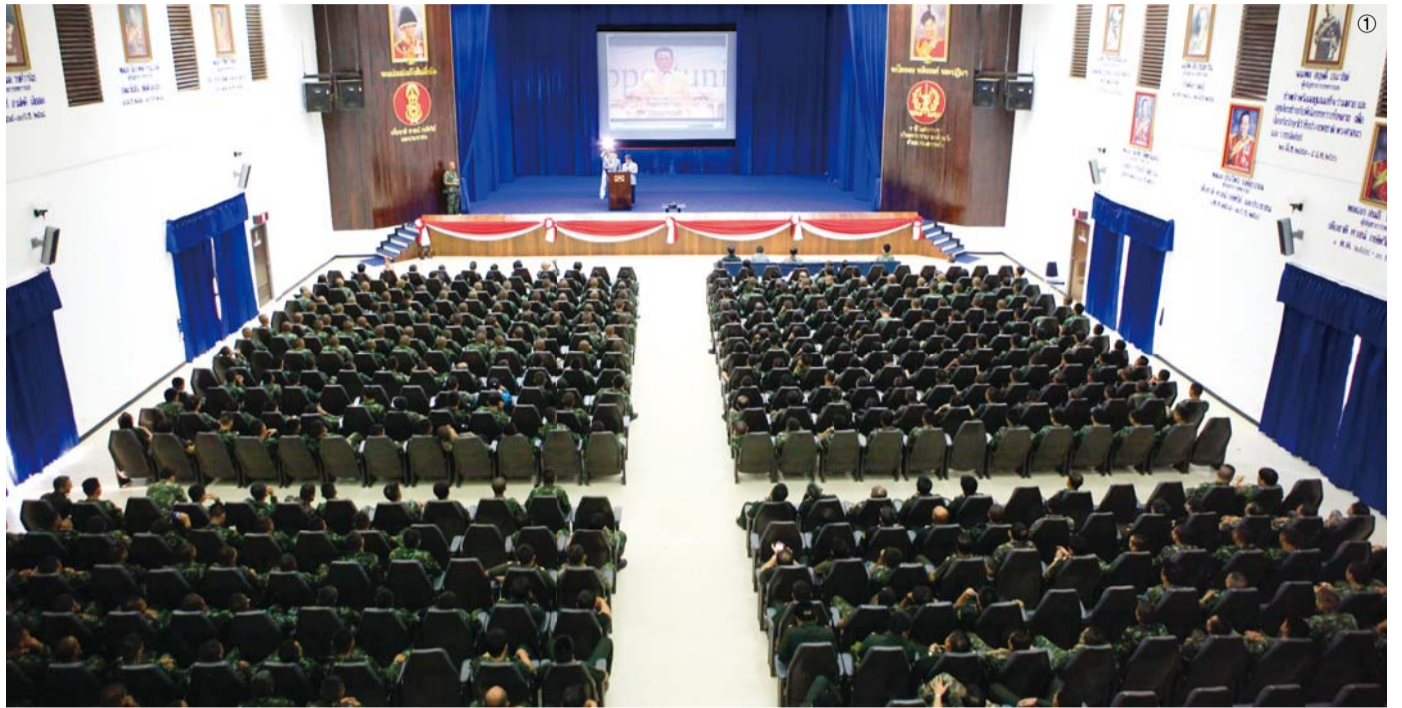
Арван хоёр өдрийн турш Тайландад Пасторын Семинарууд болон Алчуурт Эдгээлтийн Уулзалтууд тус тус зохион байгуулагдсан юм. Манмин Сүмийн агуу гайхамшигт сургаал номлолууд тараан тунхаглагдаж Вант Улсын Цэргийн Академи болон Залуучуудын Хорих Газар агуу гайхамшигт тоглолтуудыг хийж үзүүлэв. ■ Фото 1: Гуравдугаар сарын 15-нд болсон Вант Улсын Цэргийн Академи ■ Фото 2: Пастор Сунгчил Лее гуай (урьд талын эгнээний зүүн талаасаа гурав дахь нь) болон Номлогч Жаевон Лее (зүүн талаасаа хоёр дохь нь) ба Тайландын цэргийн генералууд ■ Фото 3: Гэрлийн Дуу Эгшиг Найрал Дуулаачид

Буддын шашинтан нь 95% болох Тайланд улсад Ариун Сүнсний үйл ажиллагаа болон Бурханы ариун гэгээн сургаал мэндлэн бий болов.