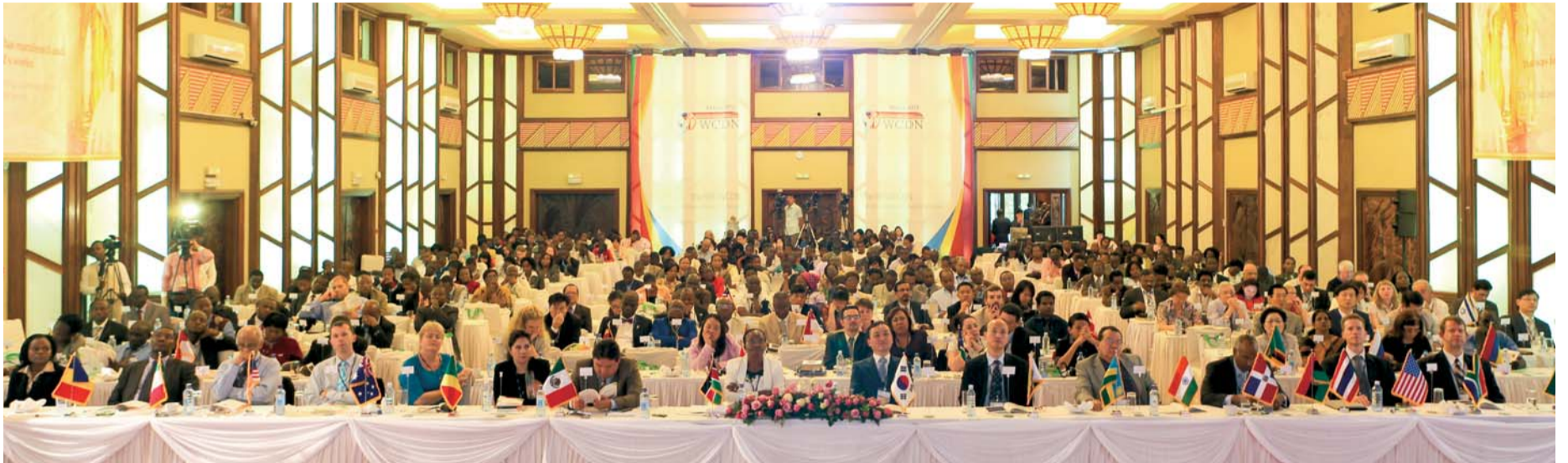
Африкийн Кени улсад зохион байгуулагдсан ДХЭС-ний Олон улсын 9-р конференц уулзалтанд нийт 37 орны 400-аад эмч нар оролцов. Амьд Бурханы агуу гайхамшигт хүчит үйлсүүдийн танилцуулга тавигдсан ба анагаах ухааны онолын хатуу ойлголтуудыг буталж өгч тэдэнд Бурханд итгэх итгэлийн үрийг суулгах чухал арга хэмжээ болж өнгөрлөө.

2012 оны Тавдугаар сарын 25-26-нд WCDN(Дэлхийн Христийн Эмч нарын сүлжээ) зохион байгуулагдсан Олон Улсын Христийн Эмч Нарын 9-р чуулга уулзалт Кени улсын Найроби хотын Сафари Парк зочид буудалд болж өнгөрөв.