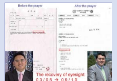
Хам Жун уг сүмд үйлчлэгч