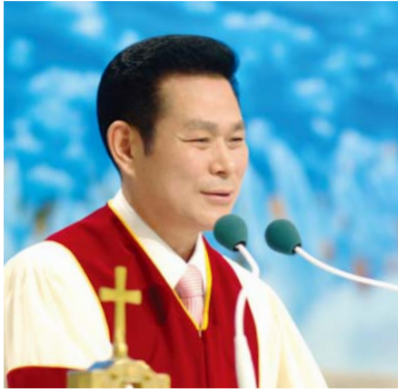
Доктор И Жей руг Тэргүүн Пастор

“Хайр бол тэвчээртэй, энэрэнгүй юм. Хайр атаархдаггүй, бардам зан гаргадаггүй, ихэрхдэггүй” (1 Коринт 13:4).