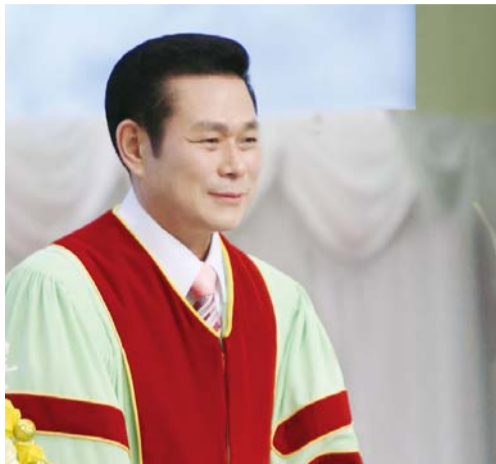
И Жей руг пастор

“Харин дээрээс ирэгч мэргэн ухаан нь нэгд ариун, тэгээд амар тайван, эелдэг, ул суурьтай, өршөөл ба сайн үр жимсээр дүүрэн, ялгаварладаггүй, хоёр нүүр гаргадаггүй аж. Үр жимс нь зөв байгчийн үр нь амар тайвныг бүтээгчдээр амар тайванд таригддаг юм” (Иаков 3:17-18).