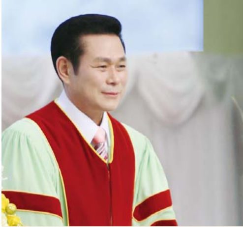
И Жей руг пастор

“Харин дээрээс ирэгч мэргэн ухаан нь нэгд ариун, тэгээд амар тайван, эелдэг, ул суурьтай, өршөөл ба сайн үр жимсээр дүүрэн, ялгаварладаггүй, хоёр нүүр гаргадаггүй аж. Үр жимс нь зөв байгчийн үр нь амар тайвныг бүтээгчдээр амар тайванд таригддаг юм” (Иаков 3:17-18).