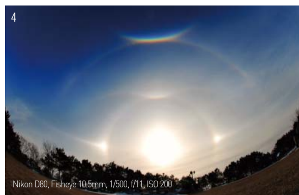
Nikon D80, Fisheye 10.5mm, 1/500, f/11, ISO 200

तर, सन् १९९८ मे १५ मा मानमिन केन्द्रिय चर्चको माथि सूर्यको वरिपरि पहिलो पटक गोलाकार इन्द्रेनी देखा परेपछि, केन्द्रिय चर्चका साथै कोरिया भित्र र बाहिर रहेका मानमिनका शाखा चर्चहरूमा हुने कार्यक्रमहरू र समर रिट्रिट जस्ता बाह्य कार्यक्रमहरू अनि मिशन यात्रामा समेत निरन्तर रूपमा इन्द्रेनीहरू देखा परिरहेका छन्।