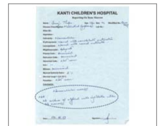
बोन म्यारोको परीक्षणमा कुनै लिम्फोमा देखिएन