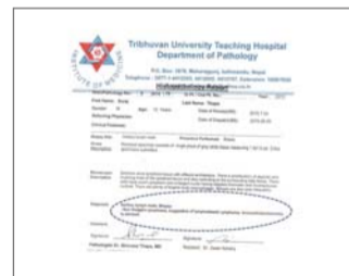
लिम्फ नोड बायोप्सीले उसमा तेस्रो चरणको लिम्फोमा भएको देखायो

म सबै धन्यवाद र महिमा जीवित परमेश्वर लाई दिन्छु जसले मेरो छोराको रोगद्वारा मेरो परिवारका सदस्यहरूलाई मुक्ति प्राप्त गर्ने अवसर दिनुभयो।