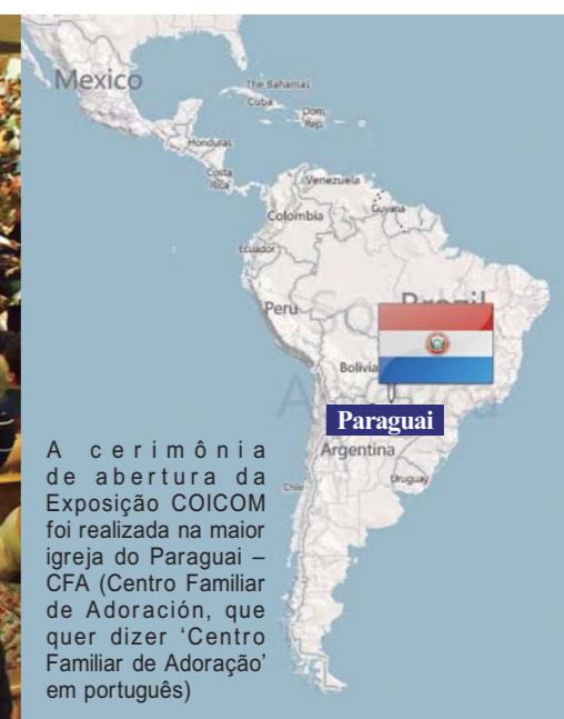
A cerimônia de abertura da Exposição COICOM foi realizada na maior igreja do Paraguai – CFA (Centro Familiar de Adoração, que quer dizer ‘Centro Familiar de Adoração’ em português)

A TV GCN tem espalhado o evangelho da santidade e o poder de Deus em aproximadamente 170 países, e recentemente participou da Exposição COICOM (Confederação Ibero-americana de Comunicadores e Mídia Massiva Cristã), um festival cristão internacional realizado em países latino americanos.