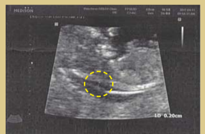
Depois da oração A pele fica com 2mm de espessura