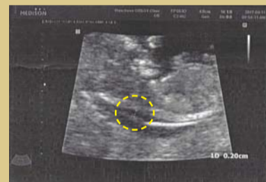
După rugăciune Pliul de la ceafa fătului se subțiază la 2 mm