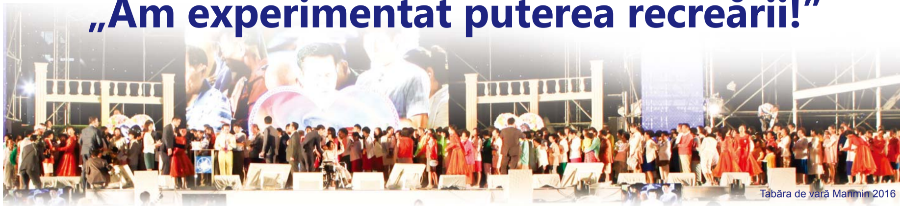
Tabăra de vară Manmin 2016

La tabăra de vară Manmin care se organizează în fiecare an la începutul lunii august, oamenii sunt vindecați de multe boli, inclusiv SIDA, depresie, atac de cord, hemoragie cerebrală, demenție și orbire. Hadeți să vedem câteva mărturii în acest sens.