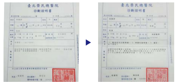
Înainte de rugăciune, diagnosticat cu demență (stânga) După rugăciune, nici un simptom