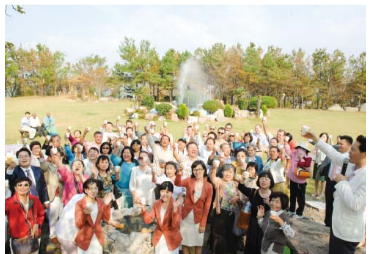
Besök till platsen för Muan sötvatten där Guds kraft uppenbarades (Muan, Jeonnamprovinsen)