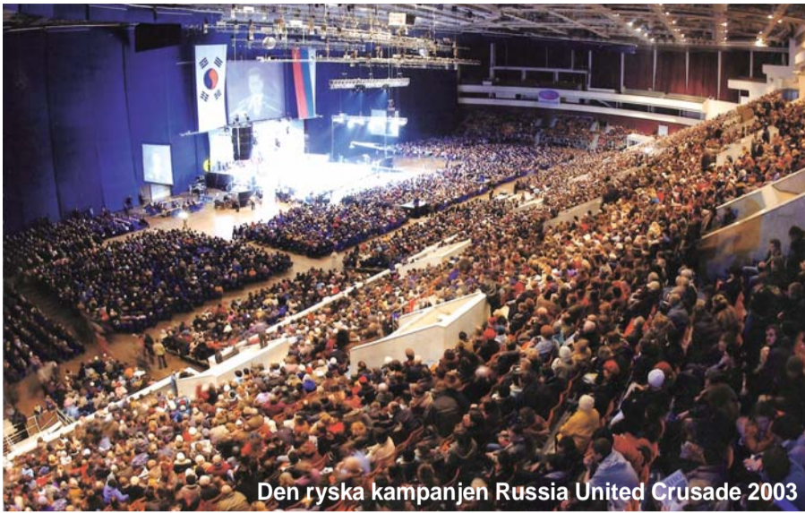
Den ryska kampanjen Russia United Crusade 2003