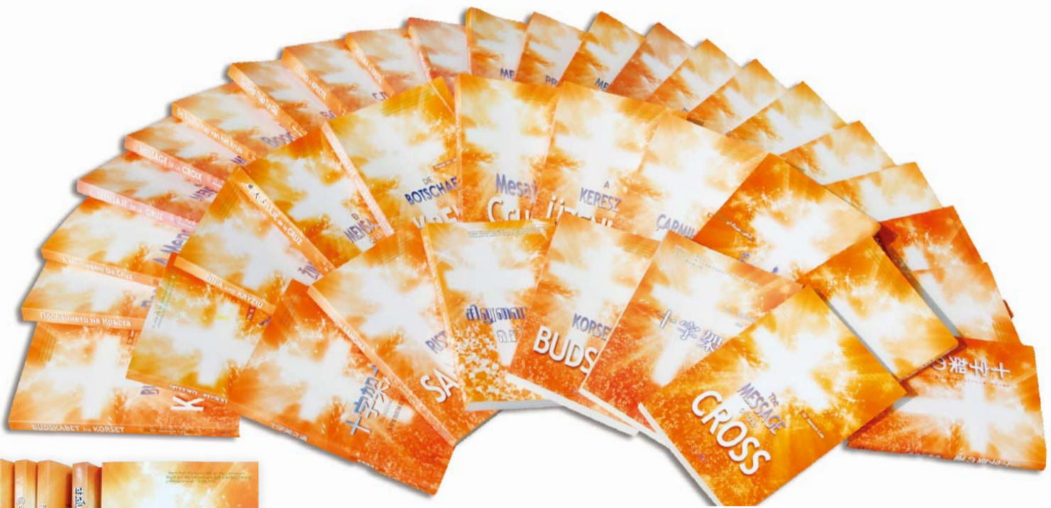
Budskapet om Korset har översatts till 56 språk och säljs i varje hörn av världen. Boken förklarar de fyra villkor som Jesus Kristus uppfyllde för att bli vår ende Frälsare.

Utgivning på flera språk av Budskapet om Korset , kärnan i evangeliet